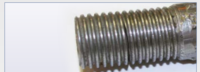
Bruch des Gewindeteils