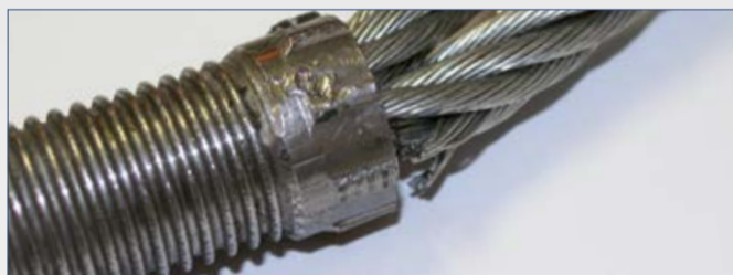
Bruch einer Litze