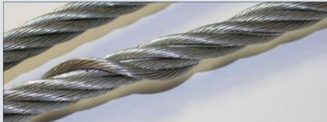
Lockerung der Außenlage

Vor der Überprüfung ist die Seilschleife zu reinigen. Bei der Prüfung der Seilschleife sind folgende Kriterien zu beachten: