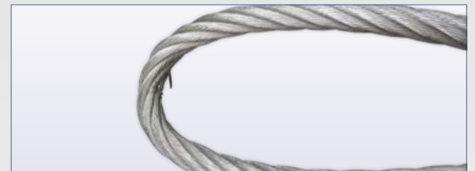
Quetschungen im Auflagebereich